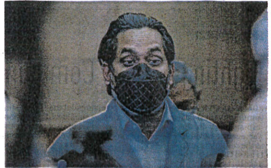
Health Minister Khairy Jamaluddin says the confidentiality of public data is guaranteed.

"The Finance Ministry, subsequently, through a letter on Feb 28, 2022, approved the Health Ministry's application to procure