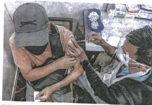
PAKAR-PAKAR kesihatan meminta dua juta penerima vaksin premier Sinovac segera mendapatkan dos penggalak bagi mengelakkan mereka terkena jangkitan Covid-19 yang teruk.