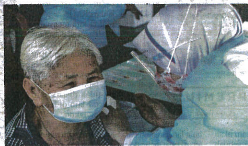
Individu yang mempunyai kormorbiditi khususnya warga emas disarankan untuk segera mendapatkan suntikan dos penggalak bagi meningkatkan sistem imun terhadap jangkitan Covid-19.

"Bagaimanapun, mungkin sudah terlambat untuk ramai yang menggunakan perkhidmat-